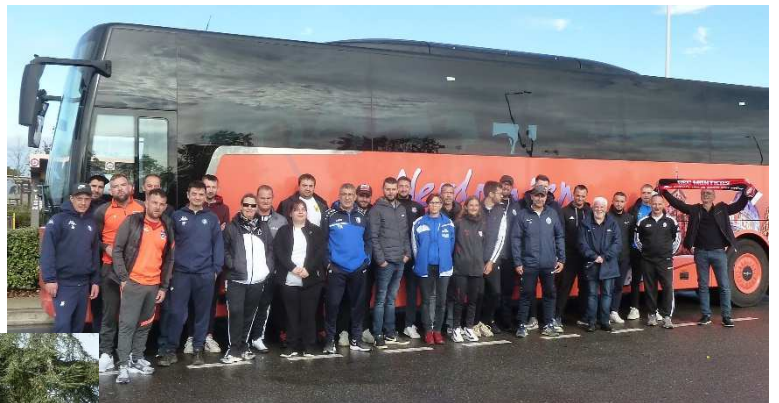
Le bus Lorrain

Un grand merci, cela va de soi, à la FFF, la LFA, la LGEF et surtout à nos Districts pour avoir facilité la tenue de ce genre d'évènements.