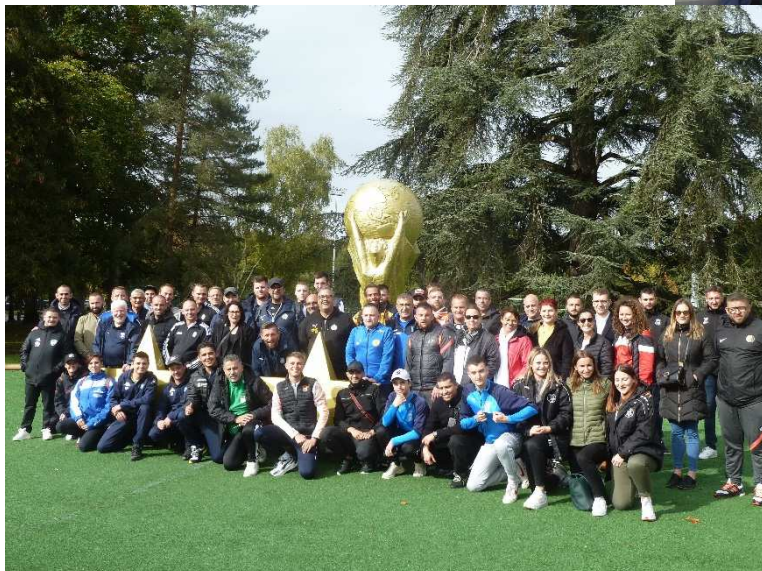
La Ligue du Grand Est réunie