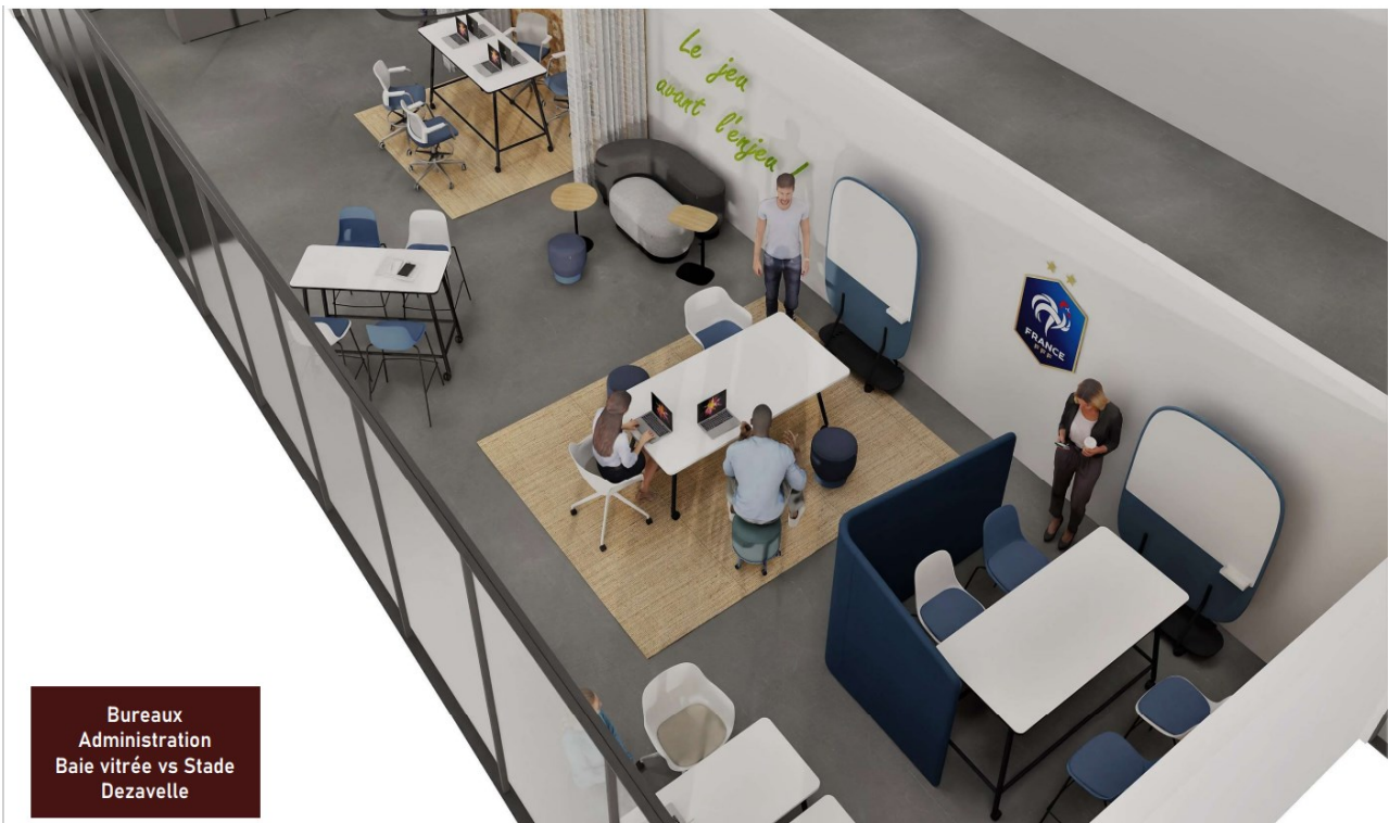
Bureaux Administration Baie vitrée vs Stade Dezavelle